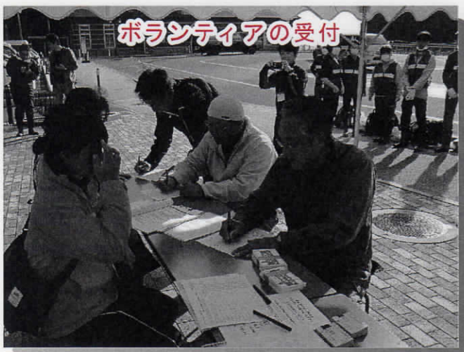
ボランティアの受付

ボランティアの皆さまをはじめ、関係者の方々にはご支援ご協力を賜り、深く感謝申し上げます。